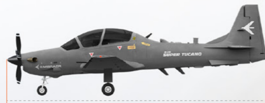
11,38 M (37 PIES 4 POL)