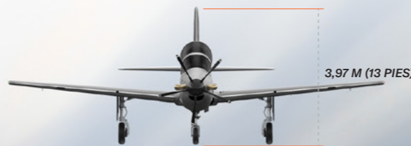
3,97 M (13 PIES)